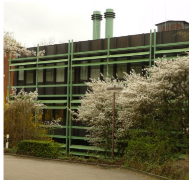
Kurt-Schumacher-Allee 1 45657 Recklinghausen

Wegbeschreibungen und viele weitere Informationen über uns finden Sie im Internet: