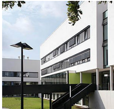
Joseph-König-Straße 40 48147 Münster